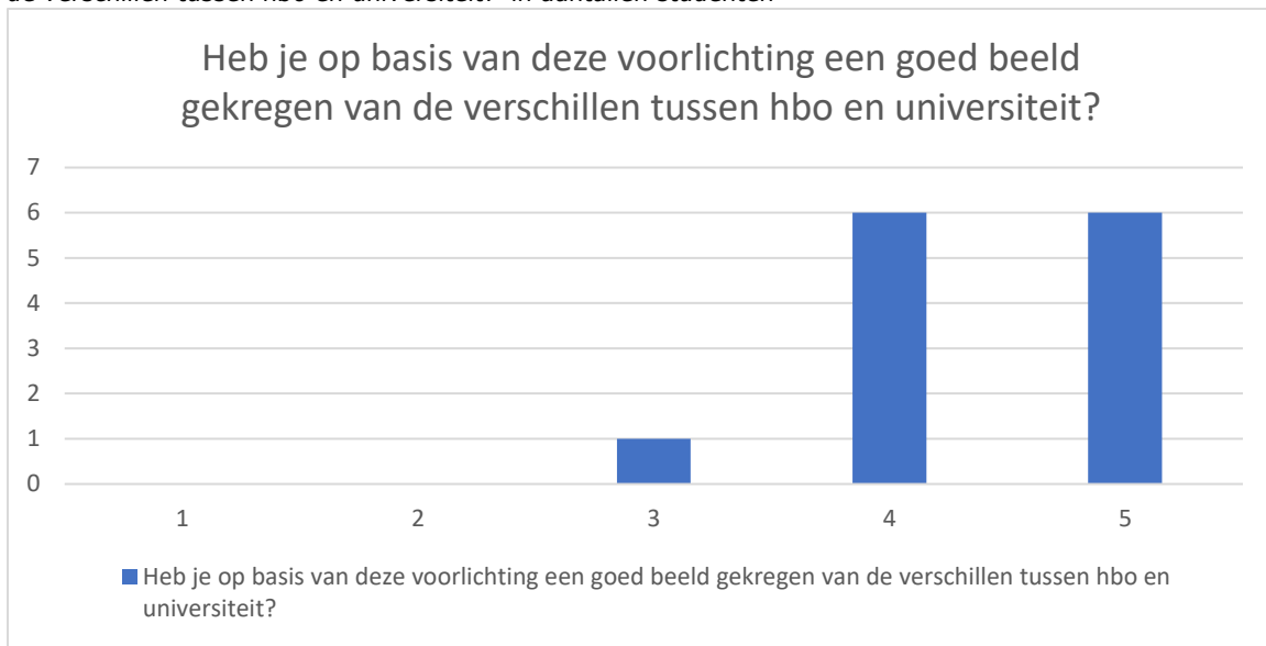
Grafiek 2: Frequentieverdeling bij de vraag 'Heb je op basis van deze voorlichting een goed beeld gekregen van de verschillen tussen hbo en universiteit?' in aantallen studenten

Ze geven allemaal aan nieuwe informatie gekregen te hebben, waar ze naar op zoek waren.