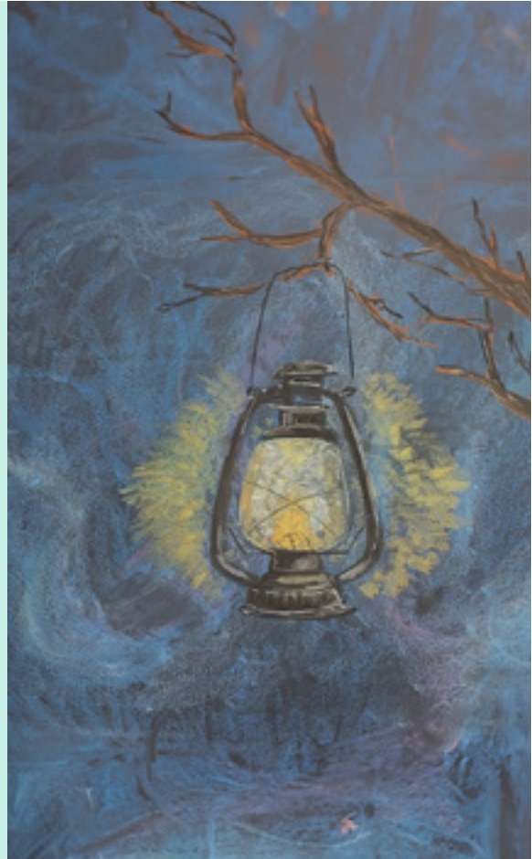
Voorbeeld van een bordtekening op een Vrijeschool. (Tessa Ouwersloot, 2024)

November, december en januari zijn de donkerste maanden van het jaar. Rudolf Steiner beschrijft ze als maanden waarin de aarde op het noordelijk halfrond teruggetrokken lijkt in zichzelf. De zon heeft zijn laagste punt bereikt en de natuur lijkt dor en dood. Het licht dat in de lente en zomer van de zon komt, moeten we nu uit ons zelf zien te halen. In de Vrijeschool worden in deze periode van oudsher vier feesten gevierd: Sint Maarten, Sinterklaas, Kerstmis en Driekoningen. Al deze feesten gaan in essentie over delen en de terugkeer van het licht na een lange periode van duisternis. Niet iedereen kan zich identificeren met deze christelijke feesten. In het kader van diversiteit en inclusie zijn er Vrijescholen die hierom aanpassingen hebben gemaakt in wat ze vieren in deze tijd en hoe. Zo zijn er scholen die het christelijke Sint Maarten combineren met het Hindoeïsche Divali, dat ook over het delen van licht gaat. Andere scholen vieren helemaal geen Sint Maarten, Kerstmis of Driekoningen meer. In plaats daarvan vieren zij een Lichtfeest waarin het delen en aansteken van lichtjes centraal staat.