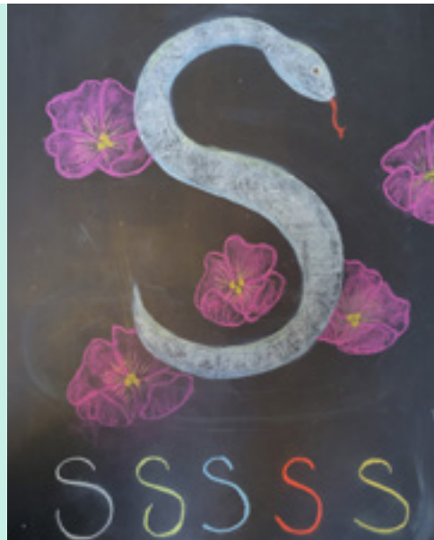
Voorbeeld van een bordtekening op een Vrijeschool. (Iris Busatto Simon, 2024)

De kinderen van klas 1 zitten vol aandacht te luisteren naar hun juf. Ze vertelt het sprookje over de witte slang – wie daar een stukje van eet kan de dieren horen praten. Het beeld dat de juf schetst, werkt in op hun verwondering en ze zien de slang zó voor zich. De juf tekent hem ook op het bord. En daar laat ze zien hoe de letter s verstoppt zit in het kronkelende lichaam van de slang. Nu gaan de kinderen ook zelf aan de slag met het maken van een tekening van de slang. En morgen schrijven ze de letter s