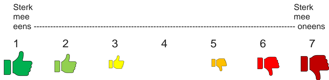
Figuur 1: 7-punts Likertschaal gebruikt bij vragen 1-9 van de evaluatie-vragenlijst

10. Aan welke manier van afnemen geeft u de voorkeur?