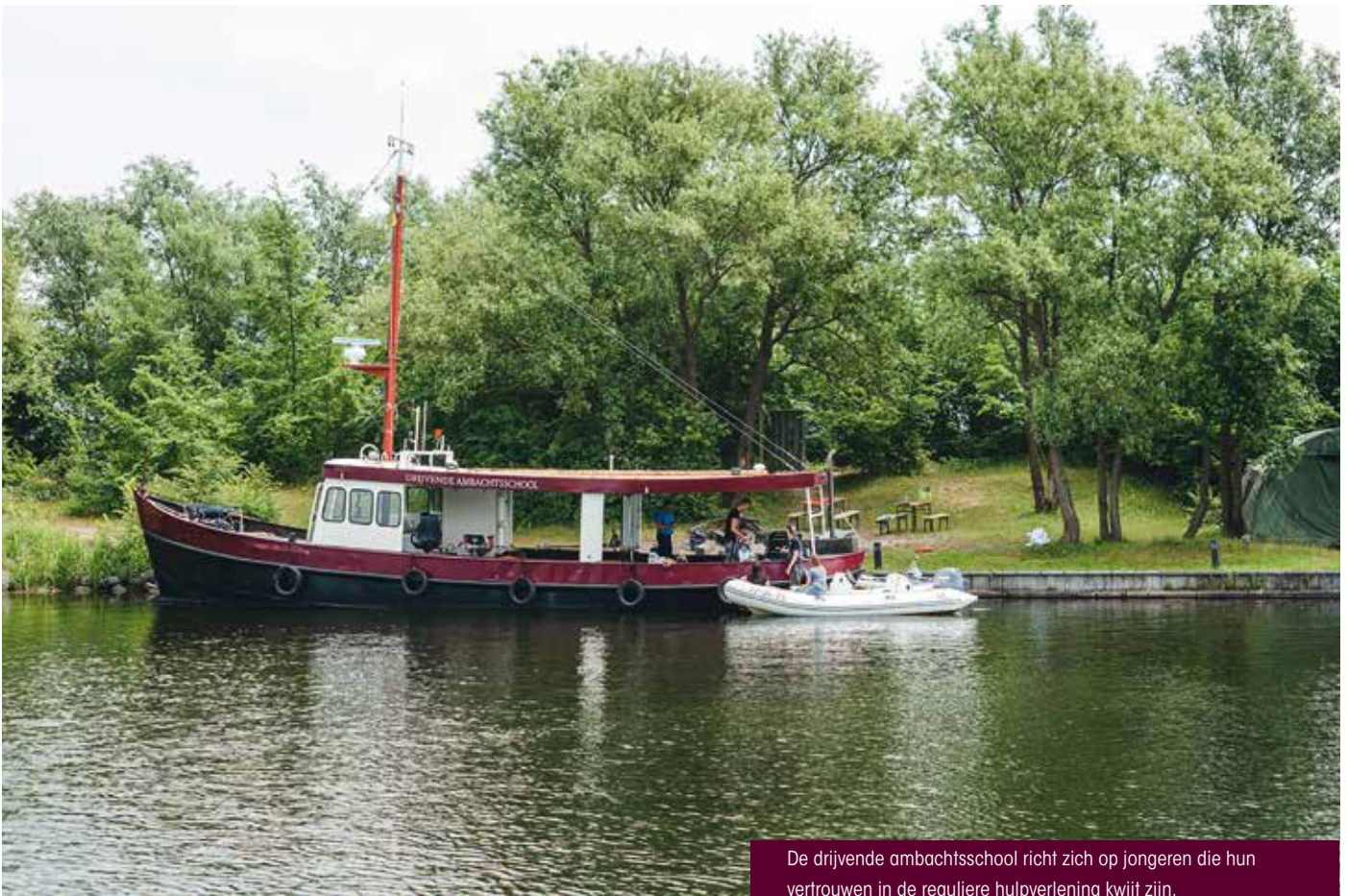
De drijvende ambachtsschool richt zich op jongeren die hun vertrouwen in de reguliere hulpverlening kwijt zijn.

er wordt gewerkt op schepen en op eilanden (dus geïsoleerd van de maatschappij). Net als op de haring-loggers leren de ervaren zeelui aan de 'jonkies' de kneepjes van het vak. Door de hoge mate van afhankelijkheid zijn de begeleiders in staat hun status op een natuurlijke manier te bevestigen ('5 procent macht gebruiken om 95 procent gezag te krijgen'). De begeleiders hebben een natuurlijke autoriteit die niet bevochten wordt: ze zijn (informele) leiders ('rolmodellen') tegen wie de jongeren opkijken en die veiligheid en betrouwbaarheid bieden. In veel gevallen zijn deze jongeren op het verkeerde pad geraakt doordat ze de verkeerde personen als rolmodellen zagen (bijvoorbeeld drugsdealers of verkeerde vrienden). Het is belangrijk dat de jongeren zich kunnen identificeren met het rolmodel en dat de jongeren het gevoel hebben dat zij worden gezien en ertoe doen. Als ervaringsdeskundigen kunnen de begeleiders van de drijvende ambachtsschool zich beter inleven in de leefwereld van de jongeren. De rolmodellen kunnen boos wor-