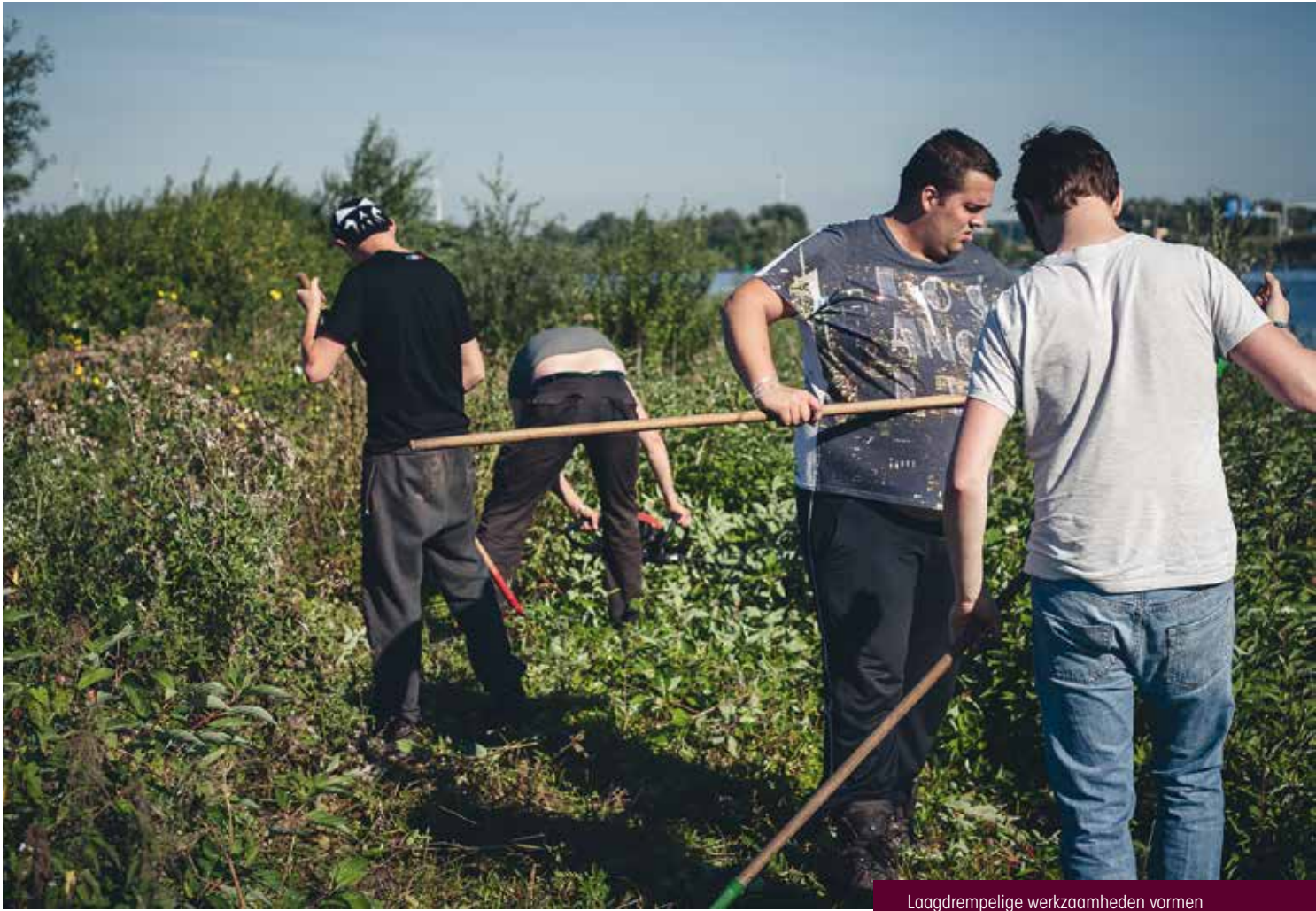
Laagdrempelige werkzaamheden vormen de basis van de drijvende ambachtsschool.