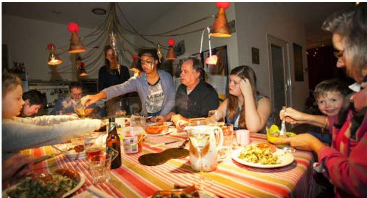
Aan tafel bij de GezinsKring in Houten (2014).

komen. De kracht van onze gemeenschapsvorming is dat zelfs kinderen met complexe zorgvragen bij ons tot rust en ontwikkeling kunnen komen.”