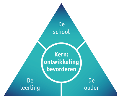
Figuur 2: Pedagogische driehoek.

Ondanks dat men nog niet overal dezelfde ‘taal’ spreekt, kunnen we op basis van ervaringen in de praktijk, de eerder genoemde reviewstudies en onze eigen onderzoeken concluderen dat betrokkenheid van ouders van belang is. Wel is het van betekenis om inzicht te hebben in wat effectieve manieren van ouderbetrokkenheid zijn, omdat sommige vormen van ouderbetrokkenheid zelfs averechts kunnen werken. Zo kan helpen bij huiswerk soms juist een negatief effect hebben op de leerprestaties van leerlingen (Bakker et al., 2013; Desforges & Abouchaar, 2003). Bijvoorbeeld doordat ouders en leerkrachten een andere instructietechniek hanteren of doordat ouders te weinig rekening houden met het leerproces van hun kinderen (Cooper, Lindsay, & Nye, 2000). Het zoeken naar werkzame vormen van ouderbetrokkenheid, lukt in de praktijk nog niet altijd. Wel streven leerkrachten in het algemeen naar een goede educatieve samenwerking met ouders om uiteindelijk de ontwikkeling van het kind te versterken. De school en ouders samen voor de leerling: de pedagogische driehoek.