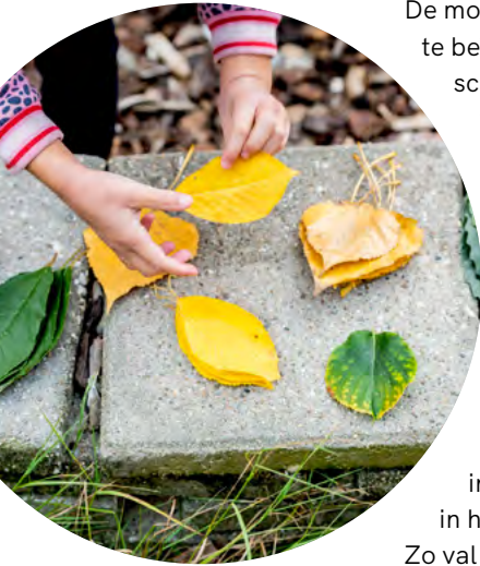
Buiten liggen de materialen voor het oprapen

► Tot ontdekken van levende en dode natuur (insecten, vogels, planten, vallende bladeren). De mogelijkheden van wisselende en minder te beïnvloeden omstandigheden, zoals licht, schaduw, zon, koude, regen, sneeuw en wind, zijn interessant. Buiten liggen de materialen voor het oprapen, verschillen de associaties met die van binnen wat inspireert tot spel, tot grote dingen ondernemen en met je handen creëren. Er ontstaat bekendheid met natuurlijke bouwstoffen, zoals aarde, zand en water. Kinderen doen hiermee spelenderwijs technisch, mathematisch en ruimtelijk inzicht op. De uitdagingen die kinderen in hun spel tegenkomen, zijn buiten anders. Zo val je eerder (en harder) als je rent, kun je een (te zware) tak makkelijk op je voet laten vallen. We zien omgaan met (kleine) risico's als aanvaardbaar en zelfs gewenst, want het maakt kinderen zelfstandig, vergroot hun zelfoplossend vermogen. Wanneer een probleem te groot is, zoek je samenwerking. Kortom, de ontwikkelingsmogelijkheden voor kinderen buiten zijn velerlei en divers van aard.