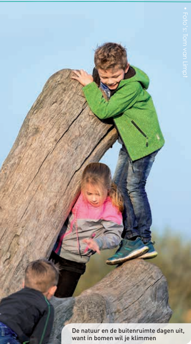
De natuur en de buitenruimte dagen uit, want in bomen wil je klimmen

(leerkracht-leerlingrelatie) en in de omgeving. Vertrouwen bouw je op met kennis van en ervaring over de leerling en de omgeving, zodat jij als leerkracht in staat bent het kind in nieuwe omgevingen in te leiden. Veel leerkrachten kennen de leerling en ze kennen de schoolomgeving, maar ze hebben niet altijd even goed zicht op de relatie die het kind met zijn omgeving heeft. De ruimte voor verbetering ligt meestal in een vierde lijn (zie figuur 1 hieronder voor een uitwerking).