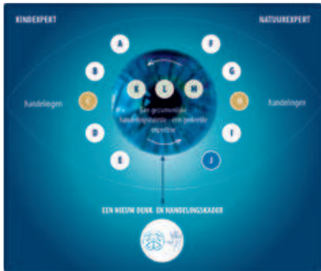
Figuur 2: Gezamenlijke expertise – van en met elkaar leren